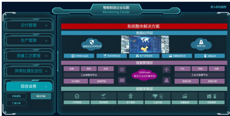
图 47 制造业的系统拓扑图

这是制造业的系统拓扑图，通过业务网关，网络设备将所有的设备信息，加工过程信息，质量信息，工艺信息，物流信息传输到云存储中进行数据分析和处理后展示/分发给监控中心和个业务模块处理人员进行处理。