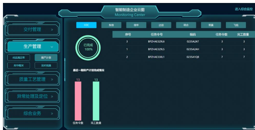
图 44 生产管理界面

2、生产管理：制造业整个预测，采购，生产调度，订单履行系统全部实现 EDI 接口，自动化执行，只有在有例外需求时才会进行人工干预。