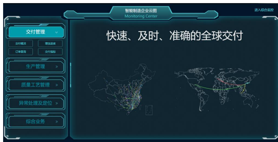
图 43 交付管理界面

2、生产管理：制造业整个预测，采购，生产调度，订单履行系统全部实现 EDI 接口，自动化执行，只有在有例外需求时才会进行人工干预。