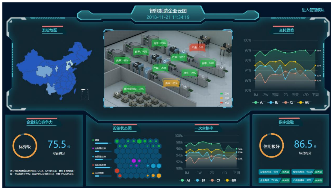
图 50 紫光企业云图 APP 应用效果图