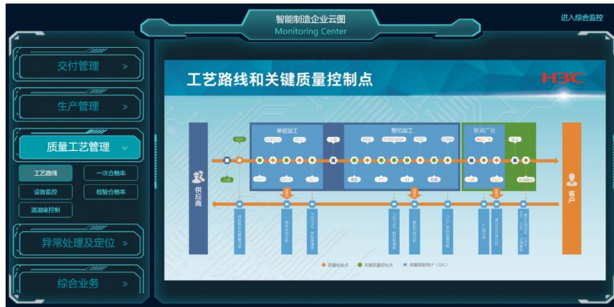
图 45 质量工艺管理界面

3、质量工艺管理：各个厂家的实时生产质量工艺状态会自动传回到制造业这里，以提高制造业的反应速度和处理效率。