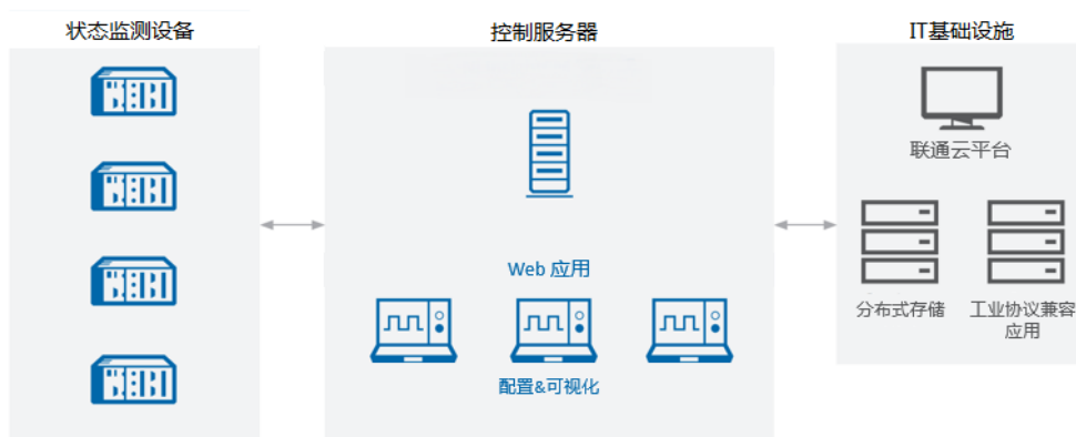
图 2 系统架构图