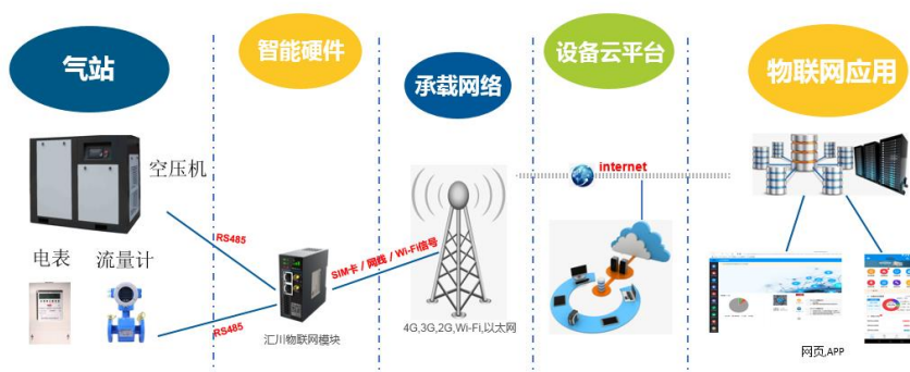
图 3 工业互联网方案部署图

LORA 网关（可选）：如采集端采用 LORA 协议，则选用通过 LORA 网关，实现数据的采集和传输。