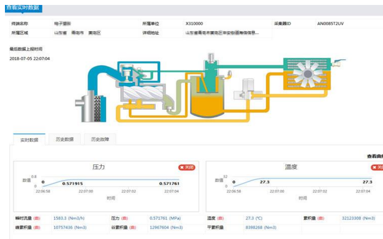
图 4 Web 端气站监控页面