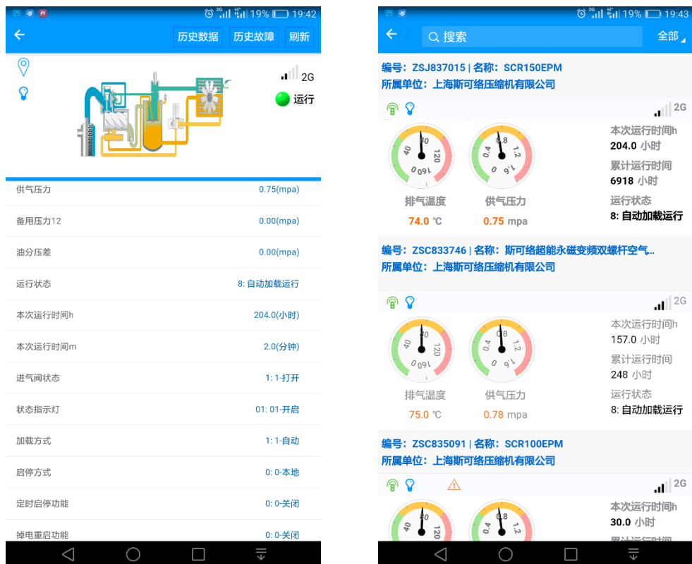
图 5 手机 APP 端界面