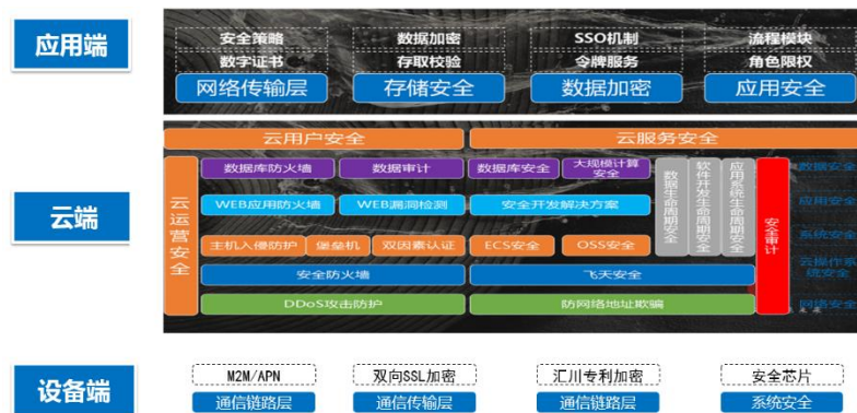
图 6 安全架构图