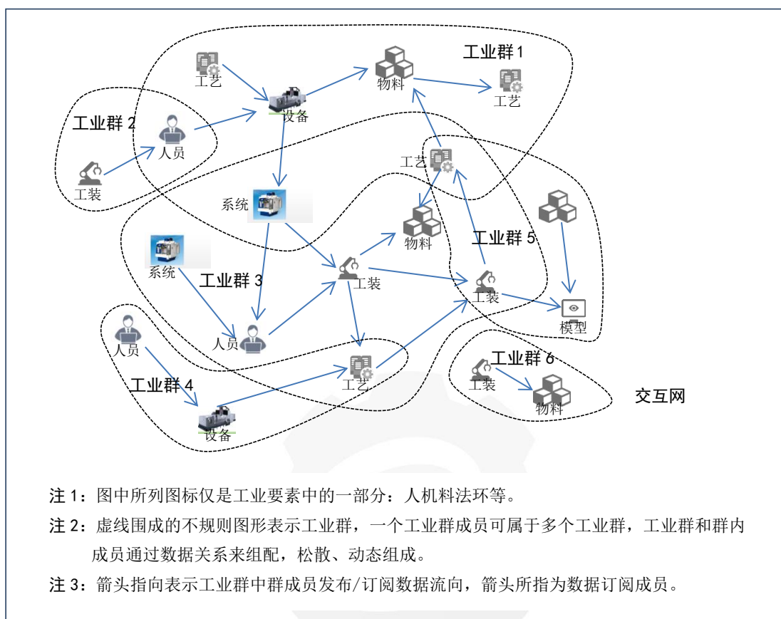
图 1 工业大数据松耦合结构